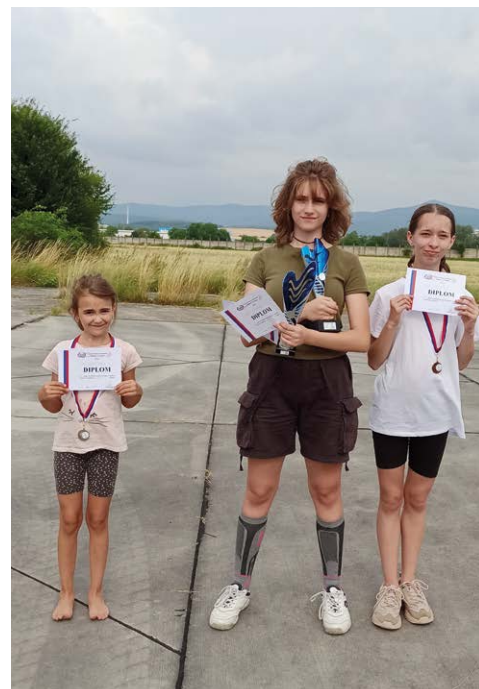
M SR v kategórii P30 - žiaci, 1.7.2023, letisko Trenčín-Biskupice.