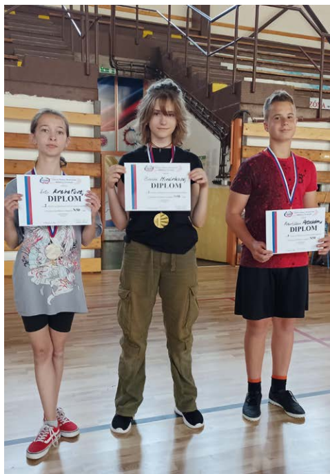
M SR v kategórii halových modeloch N50 - žiaci, 16.7.2023, Prešov.