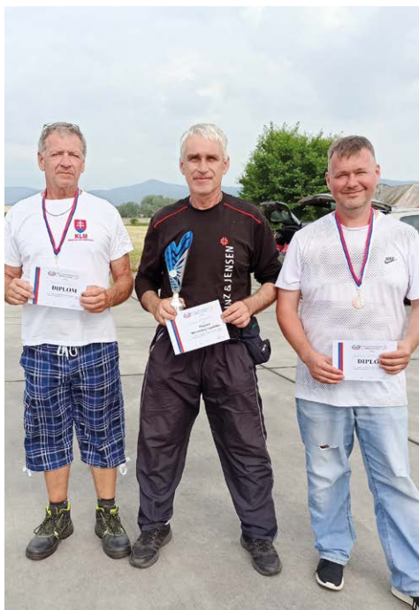
M SR v kategórii P30 - senior, 1.7.2023, letisko Trenčín-Biskupice.