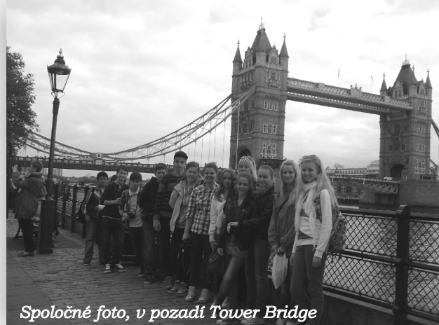
Spoločné foto, v pozadí Tower Bridge

Prvé kroky nás viedli k Royal Observatory, kde sme mali možnosť byť na dvoch miestach naraz - na západnej i východnej pologuli, rozdelení nultým poludníkom. Loďkou sme sa preplavili po rieke Temža na druhý breh a odtiaľ sme smerovali na Trafalgarské námestie, Piccadily Circus.