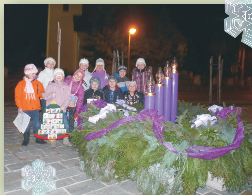
Aj našmu detskému zboru sa veniec páčil :).

Prvá adventná nedeľa 1.12. 2013 - a naše námestie pred Obecným úradom je odeté tak trochu v netradičnom šate. Všimli si to hlavne tí, ktorí prechádzajú týmto smerom. Krásny živý adventný veniec s prvou zapálenou sviecou nám pripomínal, že je čas prípravy, a nie len tej materiálnej, na vianočné sviatky.