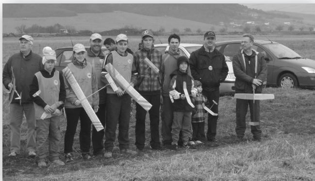
Modelári nastúpení pri otvorení súťaže „Prešovská jeseň 2013“

Záver roka sa prejavil pekným počasím a to na záverečnej tohtoročnej akcii „Prešovská jeseň“, ktorá sa konala na letisku pri Prešove 16. novembra 2013.