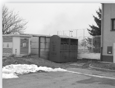
Kontajneri na textil, hračky a obuv pri ŠA