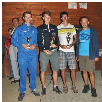
Porúbska 11