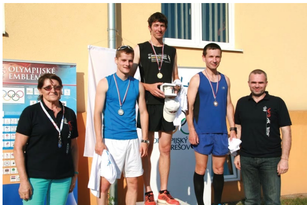
Beh olympijského dňa - foto : Vlado Blaško