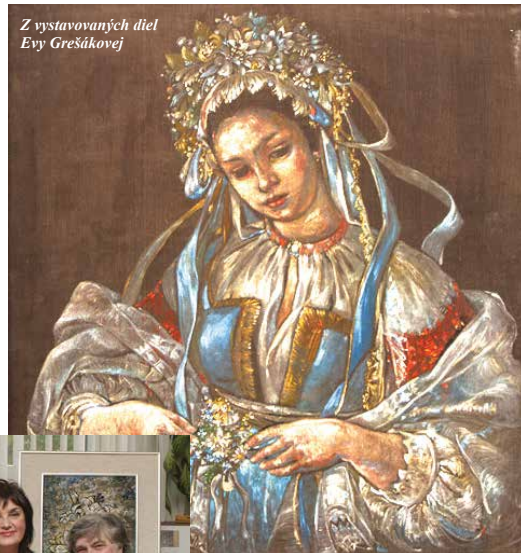
Z vystavovaných diel Evy Grešákovej