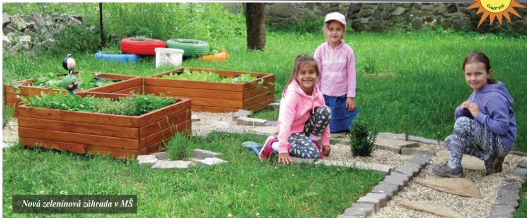
Nová zeleninová záhrada v MŠ