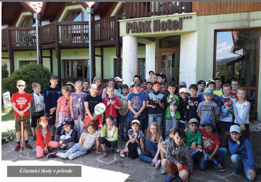
Účastníci školy v prírode

Navštívili sme ZOO v Spišskej Novej Vsi. Videli sme tam množstvo zvierat od kôz, kačíc, labutí, pštrosa, daniela, páva, opíc, po vtáky, kone a pod.. Videli sme aj ťavu, v akváriách veľké pirane, hady, pavúky, malé krokodíly. No najviac deti zaujal veľký orangutan.