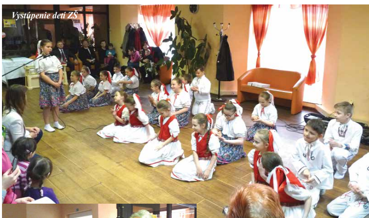
Vystúpenie detí ZŠ