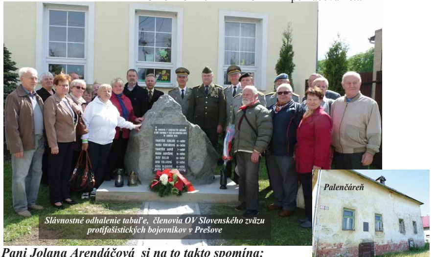
Slávnostné odhalenie tabuľe, členovia OV Slovenského zväzu protifašistických bojovníkov v Prešove